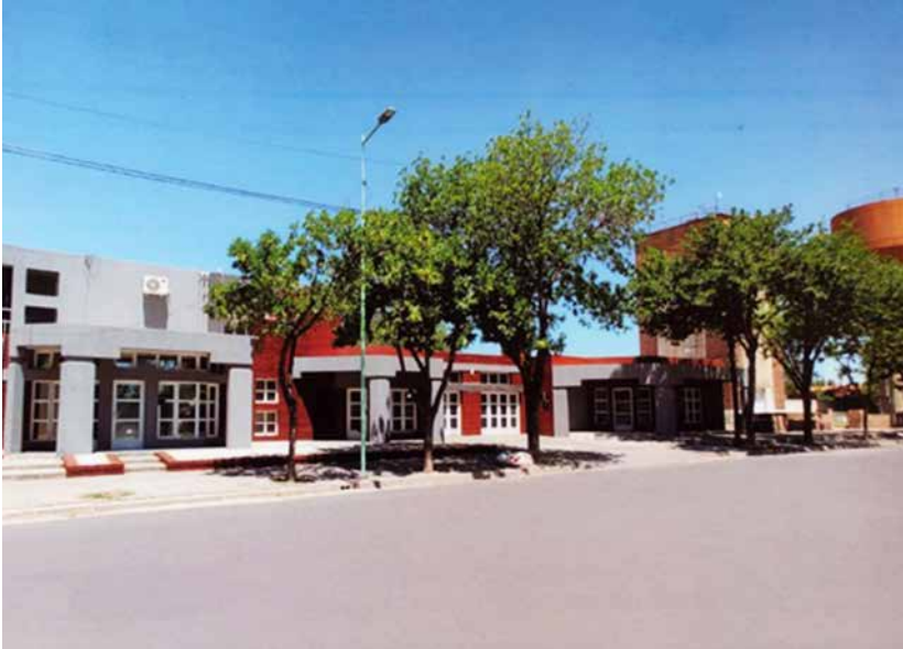
Cooperativa de Provisión de Agua, Otros Servicios y Obras Públicas de Pellegrini Ltda. (Foto actual, diciembre de 2023).

que demoraron en lograr las salas velatorias, una obra digna que merecía la comunidad pellegrinense.