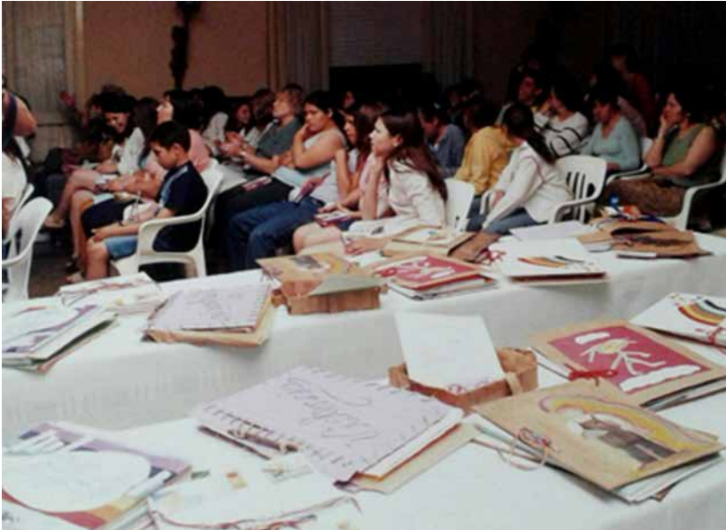
Trabajos y alumnos participando.

Dentro de la motivación a la acción cooperativa destacamos el trabajo con las escuelas para la participación en el Concurso anual organizado por FEDECOBA (Federación de Cooperativas de la Provincia de Buenos Aires).